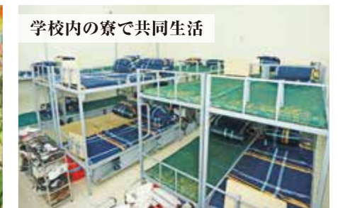
学校内の寮で共同生活